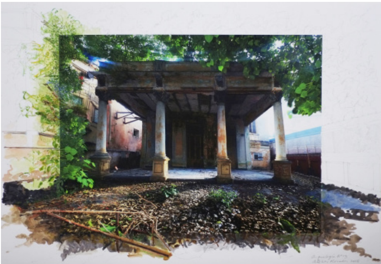
Arqueología N°13, 2015. Impresión sobre tela, 42 x 60 cm