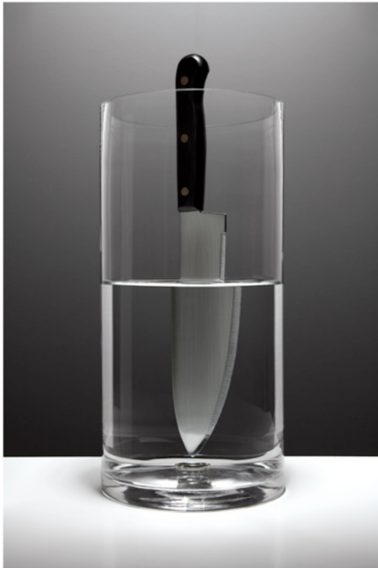
Adversity, 2015. Fotografía Inkjet Print, montada en cintra, recubrimiento de laminado mate, 28 x 39 cm

El trabajo de Torres es un relato de la vida y la sociedad que nos conforma, mostrando la fragilidad y fortaleza de los personajes, objetos, atmósferas que lo conforman.