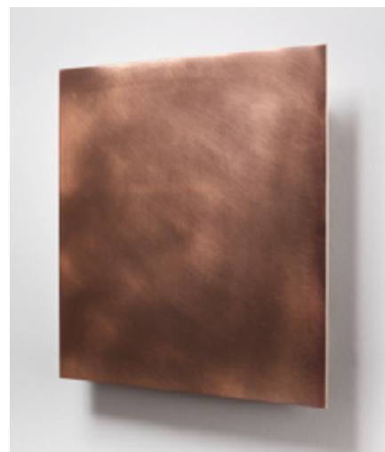
Rosa Brun. Aurepi III , 2014 Cobre sobre madera, 39 x 40 x 4 cm